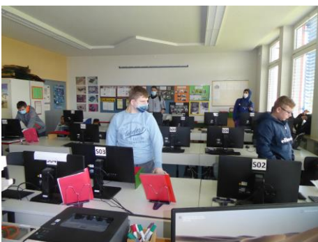
Unterricht in Wirtschaft