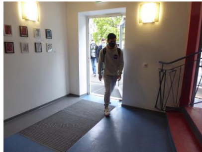
Die Gänge waren abgeteilt und Einbahnstraße

Durch den Lehrereingang betraten die Schüler im Gänsemarsch und mit Abstand das Schulhaus. Und dann erst einmal Händewaschen .